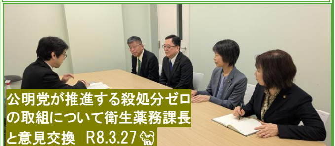
公明党が推進する殺処分ゼロの取組について衛生業務課長と意見交換 R8.3.27

令和8年度より 電話による事前予約制に変更 となりました。 受付＝各相談日の1ヶ月前より先着順で承ります。平日9時～17時 相談＝12:30～16:00(1組30分以内) 5月19日(火) 6月16日(火) 7月21日(火) 8月18日(火) 場所＝甲府市上石田1-13-21 TEL 055-222-7243